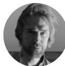
PONTUS LIDBERG | Directeur du Ballet de l'Opéra de Nice

Sous la direction de Pontus Lidberg, le Ballet de l'Opéra Nice Côte d'Azur ouvre un nouveau chapitre de son histoire. Fort d'une tradition ancrée dans le grand répertoire classique, l'ensemble affirme aujourd'hui une identité résolument contemporaine, tournée vers la création et le dialogue entre les styles. Cette nouvelle ère artistique repose sur une double ambition : préserver l'excellence technique des interprètes tout en invitant des voix chorégraphiques majeures de notre temps – artistes confirmés et talents émergents – à imaginer des œuvres originales pour la compagnie.