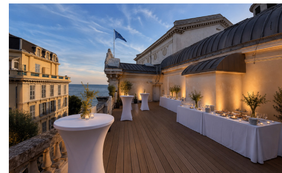
Terrasse vue mer, projection d'un cocktail avec aménagements

*Dans la limite des contreparties valorisées, pouvant représenter jusqu'à 25% du montant du don.