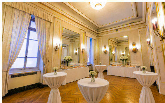
Foyer des mécènes, cocktail dînatoire