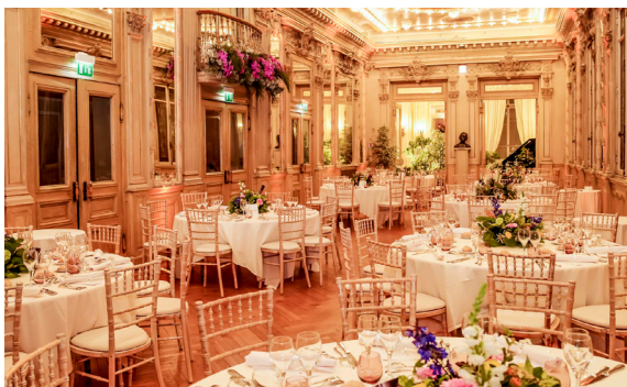
Grand Foyer, dîner